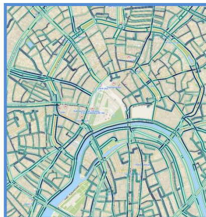
Online карта аварийности Р-Телематика