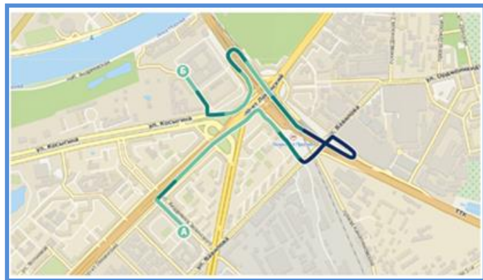
Отображение коэффициентов аварийности на треке

Имея информацию о передвижении ТС за период, возможно рассчитать вероятность попадания в ДТП относительно пройденных зон